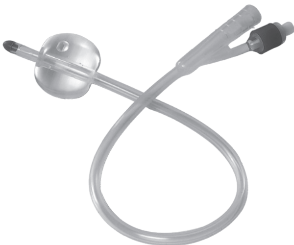
sonde de Foley

Retournez à l'unité – Date : _____ à _____ h _____