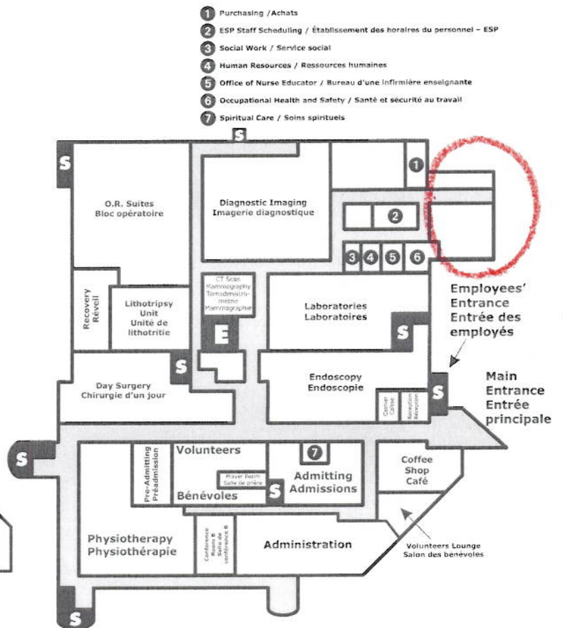
Main Floor (Level 2)